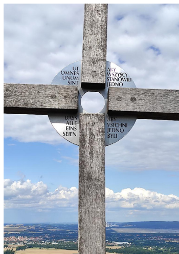
Der Herzenswunsch Jesu, dass alle eins seien, gilt jedem Menschen.

Da sind die spontanen Einfälle , die Gedankenblitze und die „Ein-