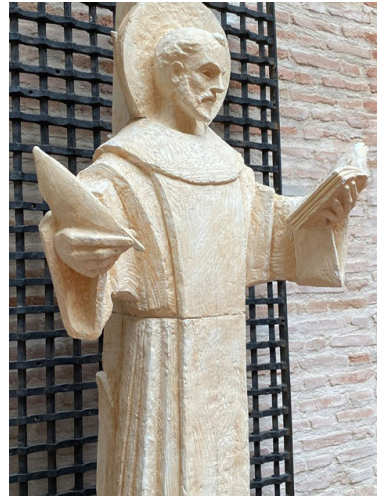
Juan de la Cruz

Juan de la Cruz wuchs in einer Kultur auf, in der Lyrik allgegenwärtig und ganz selbstverständlich mit Singen verbunden war; und das galt nicht nur für die einfachen Schlager jener Epoche, sondern genauso für anspruchsvolle Kunstlieder großer Dichter. Eine ausgeprägte Freude am Singen ist für die Spanisch sprechenden Kulturen in der Alten und der Neuen Welt bis