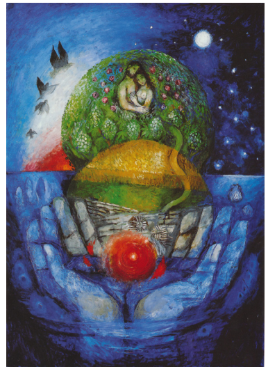
Sieger Köder, SCHÖPFUNG

Eine Antwort könnte sich aus dem Begriff creatio continua herleiten lassen, der auf die Theologen der ersten christlichen Jahrhunderte