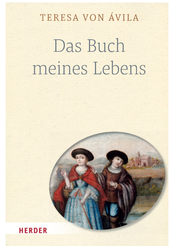
Teresa von Ávila, Das Buch meines Lebens, Verlag Herder 2020 (s. S. 22 in diesem Heft).