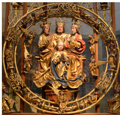
Dreifaltigkeitsdarstellung mit der „Krönung Mariens“ in der Basilika der Benediktinerabtei Seckau, Steiermark/Österreich, 1489.

anderen. Sie bewegen sich miteinander und umeinander und ineinander und verändern sich „von Herrlichkeit zu Herrlichkeit“. Und es ist die Macht der vollkommenen Liebe, die jede Person so sehr aus sich herausgehen lässt, dass sie ganz in den anderen präsent ist. Das bedeutet umgekehrt, dass jede trinitarische Person nicht nur Person ist, sondern zugleich auch Lebensraum für die beiden anderen darstellt. Jede Person macht sich in der Perichoresis „bewohnbar“ für die beiden anderen und stellt den weiten Raum und die Wohnung für die beiden anderen bereit. Man sollte also nicht nur von den drei trini-