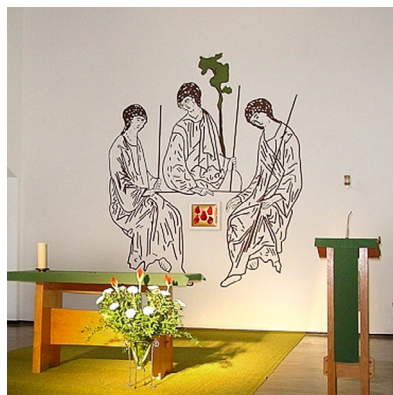
Altarraum in der Klosterkirche Birkenwerder mit einer stilisierten Nachzeichnung der Dreifaltigkeitsikone von Andrej Rubljow

Neben den am meisten bekannten Ignatianischen Exerzitien gibt es auch andere Exerzitienformen, die aus den verschiedenen geistlichen Traditionen der Kirche, der Orden vor allem, hervorgegangen sind. Mit unterschiedlichen methodischen Akzentsetzungen wollen sie demselben Anliegen – der Glaubensvertiefung und Lebenserneuerung – dienen. In den letzten Jahrzehnten sind viele dieser Exerzitienformen wieder aufgelebt, und manche wurden aus den je eigenen spirituellen Quellen heraus neu entwickelt. So auch die Form der Karmelitanischen Exerzitien.