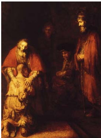
Rembrandt van Rijn (1606-1669), „Heimkehr des verlorenen Sohnes“ (seit 1766 in St. Petersburg, Eremitage)

In seiner ersten Enzyklika, betitelt mit dem Satz aus dem Ersten Johannesbrief GOTT IST DIE LIEBE , hat Papst Benedikt diese Gottes-sicht Jesu in Erinnerung gebracht. Er schreibt: „In diesen Worten aus dem Ersten Johannesbrief ist die Mitte des christlichen Glaubens, das christliche Gottesbild und