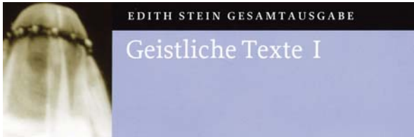
Edith Stein, Geistliche Texte I , ESGA Bd. 19

Zwiesprache des Herzens mit Gott “, so lesen wir da, „werden die lebendigen Bausteine bereitet, aus denen das Reich Gottes erwächst, die auserlesenen Werkzeuge geschmiedet, die den Bau fördern. Der mystische Strom, der durch alle Jahrhunderte geht, ist kein verirrter Seitenarm, der sich vom Gebetsleben der Kirche abgesondert hat – er ist ihr innerstes Leben. Wenn er die überlieferten Formen durchbricht, so geschieht es, weil in ihm der Geist lebt, der weht, wo er will: der alle überlieferten Formen geschaffen hat und immer neue schaffen muß. Ohne ihn gäbe es keine Liturgie und keine Kirche. (...) Darum geht es nicht an, das innere, von allen überlieferten Formen freie Gebet als ‘subjektive’ Frömmigkeit der Liturgie als dem ‘objektiven’ Gebet der Kirche gegenüberzustellen. (...) Was wäre Gebet der Kirche wenn nicht die Hingabe der großen Liebenden an den Gott, der die Liebe ist?“ (55).