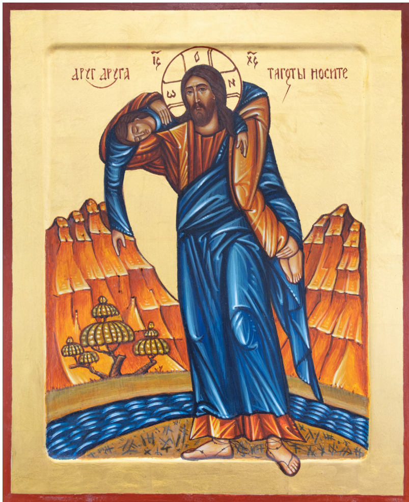
Der gute Hirt. Russische Ikone in der 2020 fertiggestellten serbisch-orthodoxen Kathedrale in Belgrad. Die Ikone zeigt, wie Jesus als der gute Hirt den Menschen ins ewige Leben hinüberträgt.