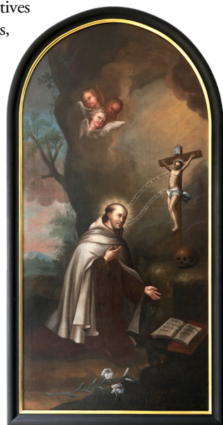
Johannes vom Kreuz Gemälde eines unbekanntem Künstlers aus dem 19. Jh., das sich im Karmelitenkloster München befindet

Juans unzweideutig positives Bild eines liebenden Gottes, der in sich drei-einige Beziehung ist, prägt nicht zuletzt auch seine christozentrische Schöpfungs- und Erlösungstheologie. Von den franziskanischen Theologen der Hochscholastik, insbesondere von Duns Scotus († 1308) inspiriert, kommt er ganz ohne Rückgriff auf die damals vorherrschende, unterschwellig bis heute weiterlebende Satisfaktionslehre aus, die den freiwilligen Kreuzestod Christi als notwendiges Sühnopfer für die durch die Sünden der Menschen beleidigte Ehre Gottes deutet. Wenn dies auch ganz dem Ehr- und Rechtsempfinden einer Feudalgesellschaft entsprach, so stößt doch heute die Vorstellung eines beleidigten Herrschers, der auf Genugtuung durch den gewaltsamen Tod eines Unschuldigen besteht, zu Recht auf Unverständnis und Ablehnung. Demgegenüber interpretiert Juan