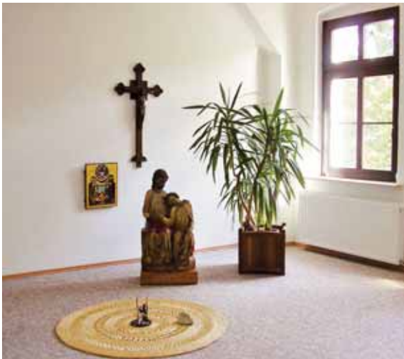
Gebets- u. Meditationsraum im Exerzitienhaus Birkenwerder

Beten“ teilgenommen. Zum selben Thema hatte ich bereits vor ca. 20 Jahren einen Exerzitienkurs mitgemacht. Beide Exerzitienzeiten haben einen tiefen Eindruck hinterlassen und Spuren in mein religiöses Leben gelegt. Das Innere Beten hat was mit mir „gemacht“, und davon will ich Dir erzählen.