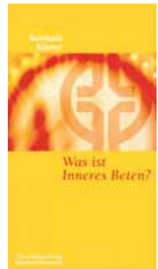
R. Körner, WAS IST INNERES BETEN? (Münsterschwarzacher Kleinschriften, Bd. 116), Vier-Türme-Verlag, 4. Aufl. 2012

Inneres Beten ist kein Randthema des christlichen Glaubens, auch nicht eine Angelegenheit allein für die „geistliche Elite“ in der Kirche – die es ja ohnehin nicht gibt. Es geht hierbei um das, was „glauben“ erst zum glauben, zur christlichen Art, Mensch zu sein macht – und zwar von seiner „Innen“-Seite her, auf die Jesus selbst so sehr Wert legte.