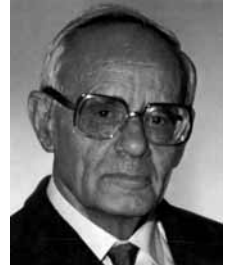
In einem Artikel von 1982 ging Karl Rahner SJ (1904-1984) der Frage nach: „Was heißt Jesus lieben?“ Wir geben hier seine Gedanken in etwas gekürzter Fassung wieder.

Aber – so scheint es zunächst zu sein – der konkrete Jesus ist doch durch den Abstand von Geschichte