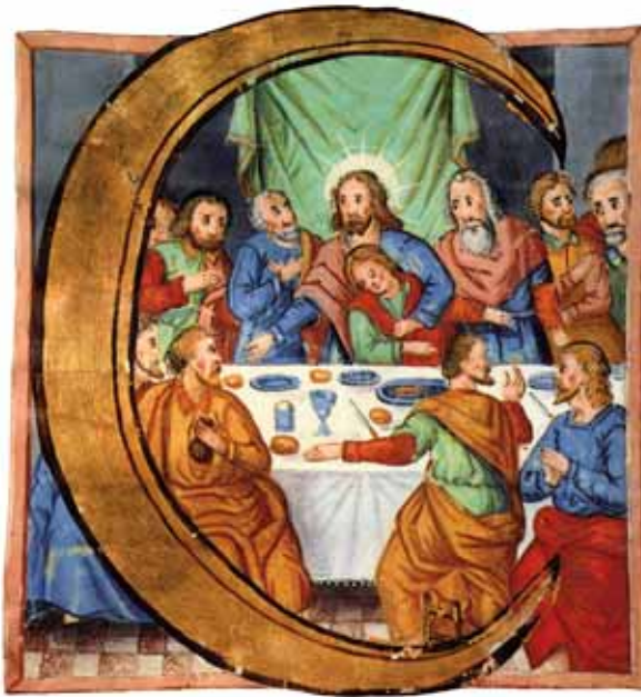
Das Mahl mit den Jüngern, Buchmalerei in einem karmelitanischen Missale, Krakau um 1644

Unter diesen beiden Voraussetzungen aber ist es wirklich möglich, Jesus zu lieben über alle Räume und Zeiten hinweg. Man liest seine Biographie, die ja nicht die Biographie einer bloßen Gewesenheit ist; diese Biographie ist ja Endgültigkeit in seiner Auferste-