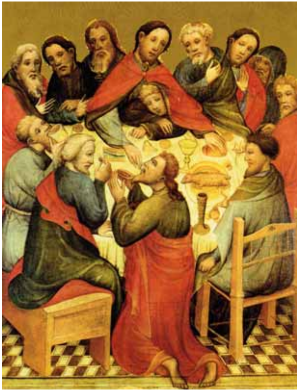
Abendmahl, Tafelmalerei um 1418 Hannover, Niedersächsische Land- esgalerie © ars liturgica Buch- & Kunstver- tag, Maria Laach (Nr. 405943)

Neue Bund in meinem Blut“, bei Lukas erweitert durch: „das für euch vergossen wird“. Der Neue Bund – ein Wort, das ebenfalls allen bekannt und vertraut war. Hatte doch schon Jeremia gesagt: „Seht, es werden Tage kommen – Spruch des Herrn –, in denen ich mit dem Haus Israel und dem Haus Juda einen neuen Bund schließen werde ...“ (Jer 31,31).