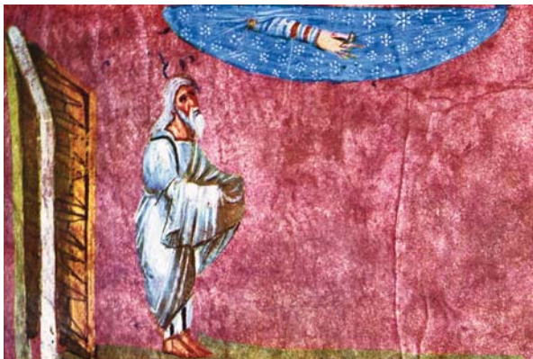
„Geh vor mir her – und sei ganz!“ (Gen 17,1)

Standortbestimmung vornehmen, wahrnehmen, was in mir ist, braucht das Innehalten. Exerziti-