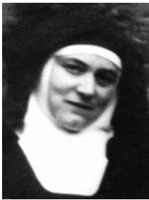
Edith Stein – Sr. Teresia Benedicta a Cruce im Karmel Echt/Holland, Foto 1941