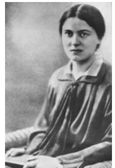
Edith Stein, Foto um 1920

Im April 1913 zog Edith Stein nach Göttingen. Sie hatte den Eindruck bekommen, „daß Breslau mir nichts mehr zu bieten hätte und daß ich neue Anregungen brauchte.“ Ihre Überzeugung, die sie sich durch die Lektüre von Husserls LOGISCHEN UNTERSUCHUNGEN gebildet hatte, dass „Husserl der Philosoph unserer Zeit sei“ , ließ ihre Wahl auf Göttingen fallen. Ganz anders als in Breslau war sie nun offen für Begegnungen, die ihr weiterhalfen, sobald der richtige Zeitpunkt gekommen war. Hier lernte sie die Phänomenologie kennen, die sie als „neue Scholastik“ bezeichnet, „weil der Blick sich vom Subjekt ab- und den Sachen zuwendete: die Erkenntnis schien wieder ein Empfangen, das von den Dingen sein Gesetz erhielt, nicht ... ein Bestimmen, das den Dingen sein Gesetz aufnötigte“ . Diese Begegnung bewirkte einen Wandel in