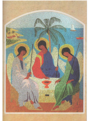
Jesus im drei-einen göttlichen Urgrund

Die „anderen Sprachen“, um das Evangelium Jesu so weiterzugeben, dass es in der Gesellschaft wenigstens gehört und möglichst von jedem verstanden werden kann, finden wir dann von selbst. Wer glauben und Glaube nicht nur als Lehre der Kirche kennt, sondern ins eigene Herz und in den eigenen Verstand aufgenommen hat, findet dafür auch die Ausdrucksformen und die Worte – wenn ihm an Gott und seinem Jesus liegt; und an Gottes Menschen.