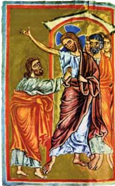
„Der ungläubige Thomas“ Evangeliar aus Köln, 1250; Königliche Bibliothek, Brüssel © ars liturgica Buch- & Kunstverlag MARIA LAACH, Nr. 5719 (als Bildkarte erhältlich)

sich darauf einlässt, kann so Hilfe und Ermutigung finden, die schmerzliche Erfahrung eigener Glaubenszweifel anzunehmen, sich auseinanderzusetzen mit dem bisher gelebten Glaubensweg und