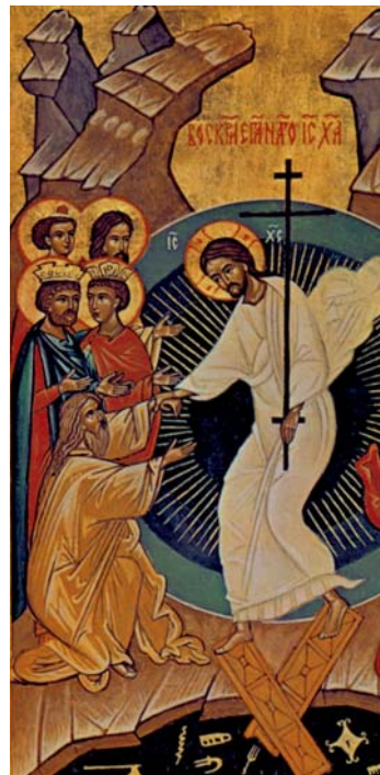
Auferstehung, russische Ikone (Ausschnitt)

„Werde ich dann bei Gott alle meine Lieben wiedersehen?“, fragte eine Frau den alt gewordenen Theologen Karl Barth. „Ja“, antwortete er, „Sie werden Ihre Lieben wiedersehen, und auch alle Ihre Nichtlieben.“