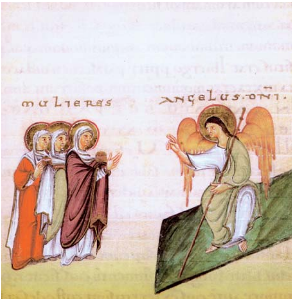
Engel und Frauen am Grab

Egbert-Kodex, gemalt von Benediktinermonichen der Insel Reichenau um 980