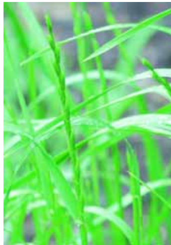
Taumelloch – dem Weizen sehr ähnlich, doch giftig für Mensch und Tier.

Bösen.“ Das Gleichnis wird allegorisch – Bildelement für Bildelement – übertragen, und zwar so, dass die Ernte zum (apokalyptischen) Weltgericht wird, bei dem „die Gerechten im Reich ihres Vaters wie die Sonne leuchten“, die anderen aber in den „Feurofen“ geworfen werden, wo sie „heulen und mit den Zähnen knirschen“.