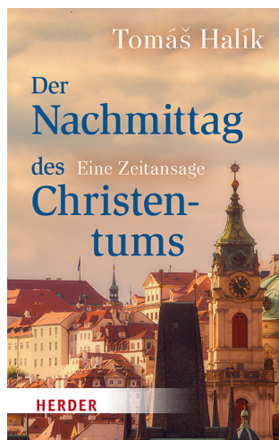
Tomáš Halík, DER NACHMITTAG DES CHRISTENTUMS. Eine Zeitansage, © Verlag Herder GmbH, Freiburg i. Br. 2022

In diesem Buch lege ich eine bestimmte Vision des Nachmittags des Christentums vor, betone aber gleichzeitig auch: Ob und in welchem Maße diese Vision erfüllt werden wird, weiß nur der Herr der Geschichte, der die Geschichte fortwährend im Dialog mit unseren Taten und mit unserem Verständnis entstehen lässt.