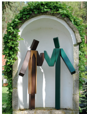
Teresa von Ávila und der Auferstandene (Grotte im Klostergelände in Birkenwerder)

Herzlich willkommen im Exerzitienhaus am Karmelitenkloster Birkenwerder!