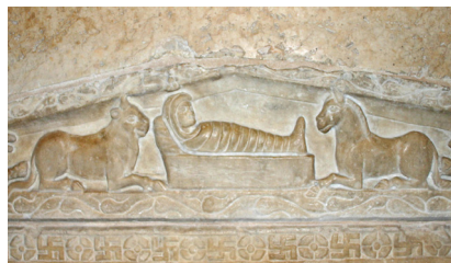
Rind und Esel an der Krippe – eine der frühesten Darstellungen dieses Motivs; um 385 in der Basilika St. Ambrosius in Mailand

Das wird ihm genügen, dem Kleinbauern aus Nazaret mit dem Herzen Gottes. Dem da in der Weihnachtskrippe, alle Jahre wieder, an seinem Geburtstagsfest.