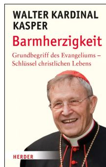
Walter Kardinal Kasper, BARMHERZIGKEIT. Grundbegriff des Evangeliums – Schlüssel christlichen Lebens, Herder, 5. Aufl. 2016

Gott ist Liebe. Das bedeutet: Er ist kein strafender, zorniger, rächender Gott. Er ist ein Gott, der