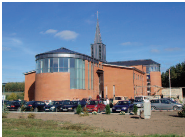
Das in den Jahren 2005 bis 2011 neu erbaute Karmelittinnenkloster in Ikšķile bei Riga/Lettland am Tag der Einweihung.

In Heft 1/2007 habe ich davon berichtet, wie unser Orden in Lettland wieder Fuß fasst – ein halbes Jahrtausend nach der Reformation. In dem Beitrag war auch ein Foto zu sehen, das die Anfänge der Bauarbeiten am Karmelittinnenkloster in Ikšķile