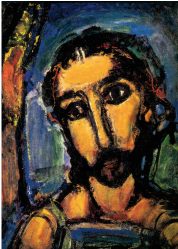
„Sucht mein Angesicht!“ (Ps 27,8)

Wir laden Sie ein, am Wochenende 18. - 20. Mai 2012 im Kloster Birkenwerder unter dem Thema „ Das Angesicht Christi in der Kunst und in mir “ Ihre eigenen Entdeckungen zu machen.