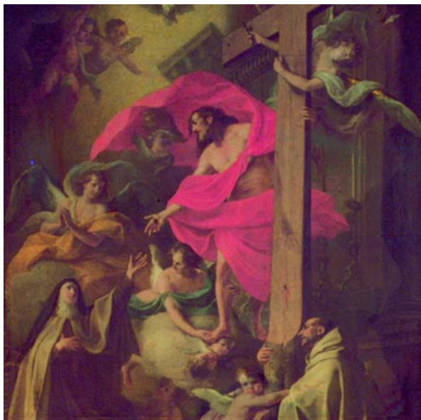
Hochaltarbild von Balthasar Augustin Albrecht (um 1750) in der Kirche des Karmelitenklosters Reisach/Oberaudorf

ist Jesus Christus in zweifacher Hinsicht: Als der Jesus von damals ist er der Lehrer des spirituellen Weges; als der auferstanden-lebende Christus ist er der Gefährte auf dem spirituellen Weg. Das wird im Leben und in den Schriften der Großen des Karmel besonders deutlich, und Bilder wie dieses in der Kirche des Karmelitenklosters Reisach (Bayern) aus dem 18. Jh. haben es den Christen