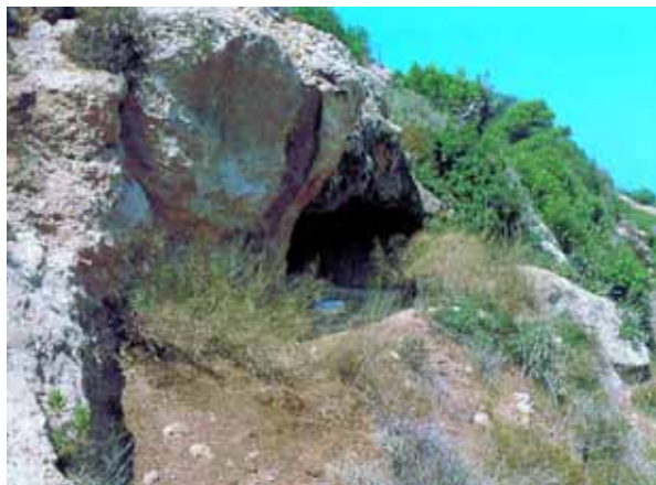
Eremitenhöhle am südlichen Hang des Karmelgebirges, aus der Zeit der ersten Karmeliten (13. Jh.)

irgendwann zwischen 2006 und 2014 (niemand weiß das Datum genau) jährt sich zum achthundertsten Mal der Tag, an dem die Karmeliten ihre Lebensregel erhalten haben. Auf Bitten der noch jungen geistlichen Gemeinschaft im Karmelgebirge schrieb