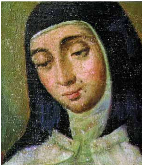
Teresa von Ávila

es viele Wohnungen.“ Und nicht von ungefähr spricht sie nahezu immer von Ersten, Zweiten, Dritten usw. Wohnungen, in der Mehrzahl also. Es ist ihr offensichtlich viel daran gelegen, ihren Lesern und