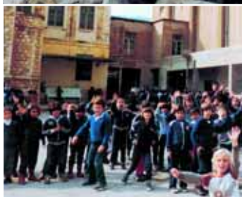
Haifa, die Stadt am Fuße des Karmel, der Wiege der karmelitani-schen Orden und Gemeinschaften