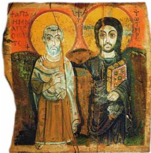
Die „Freundschaftsikon“ aus Taizé

finden, dass das Leben ohne Gott irgendwie freudlos und finster ist. Und dann ist es die Sehnsucht, die einen vorantreibt und die es nicht zulässt, dass man sich einrichtet in einem Leben ohne Gott.